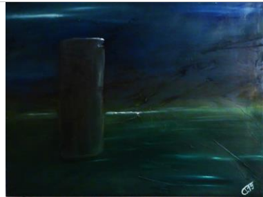
Walcheren p37, 45x60, Öl auf Leinwand, 2019