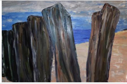
Walcheren p11, 60x90, Öl auf Leinwand, 2015