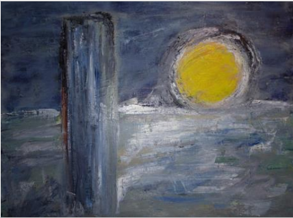
Walcheren p33, 60x80, Öl auf Leinwand, 2018