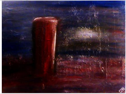
Walcheren p38, 59x79, Öl auf Leinwand, 2019