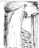
Paal, Tinte Papier, 15x10