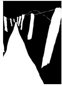
Duinweg, Tusche Papier, 40x30, 1991