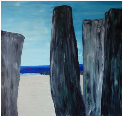
Walcheren p07, 80x80, Öl auf Leinwand, 2013