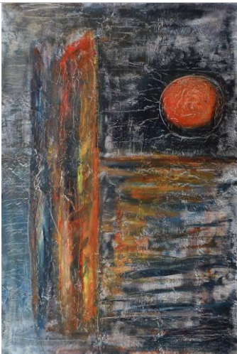
Walcheren p25, 90x60, Öl auf Leinwand, 2017