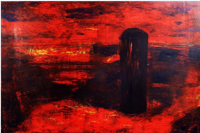
Walcheren p28, 80x120, Öl auf Leinwand, 2017