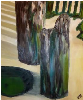
Walcheren p35, 60x50, Öl auf Leinwand, 2018