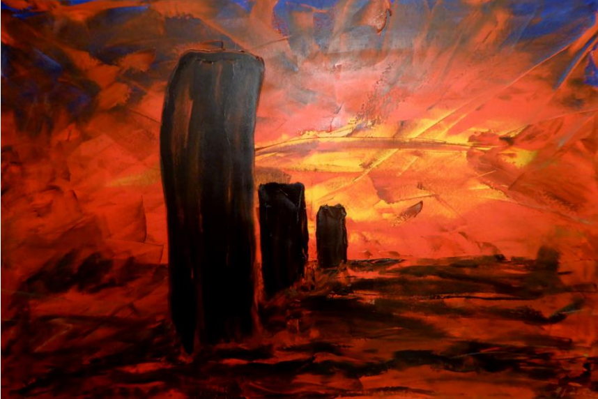
Walcheren p14, 60x90, Öl auf Leinwand, 2016