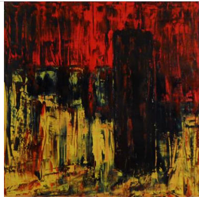
Walcheren p27, 80x80, Öl auf Leinwand, 2017