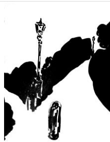
Duinovergang , Tusche Papier, 40x30, 1991